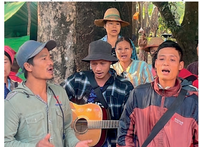
ဘးဒီး-ခရၢၣ်ယူၤဘဲး(ခ)ဂဲၤကလဲၣ်ဒီးပုၤဘၣ်ကီၢ်ဘၣ်ခဲတဖၣ်လၢကညီကီၢ်စံၣ်.ပယီၤကီၢ်. အဖိခိၣ်-ကညီပုၤဘၣ်ကီၢ်ဘၣ်ခဲတဖၣ်ဘၣ်သးကီၢ်ဘၣ်သးကီၢ်တၢ်လၢပုၤယီၤပုၤ.

ယတၢ်ယုၤထၢတဖၣ်မ့ၢ်မန့ၢ်လဲၣ်.တၢ်သးဟဲဒိၣ်ပယံၤသးမ့ၢ်ခါ.တၢ်သးဒိၣ်လၢ တၢ်အိၣ်တၢ်မၤန့ၢ်ထီၣ်ခိၣ်ခါ.သးတံၢ်တၢ်လၢဟီၣ်ခိၣ်ဒီးဘၣ်အတၢ်သးက ညီတအိၣ်ဒီးတကန့ၢ်ပုၤအယံၤခါ.သးဟးဂီၤဖိဖျါလၢတၢ်အိၣ်မုၢ်တဖၣ်ဘၣ်တၢ်ဝဲ ယယာ်တၢ်ဘၣ်ယိၣ်တဖၣ်ဒီးဘၣ်တုၤတၢ်အယံၤခါ.သးဟးဂီၤလၢတၢ်ကွဲၣ်ဘၣ် ကွဲၣ်သ့ၣ်လီၤပတၢ်အသးဖးယံၤဖးထၢလဲအယံၤခါ.မ့ၢ်တမ့ၢ်ယဟီၣ်ထွဲကညီဟံၣ်န့ၢ် ယီထၢတဖၣ်အဒိအတံၢ်သ့ၣ်.ဒီးသးလဲလိာ်သးဒ်တၢ်အထံအနီၤအသိးဒ်သိးက တုၤထီၣ်ထီၣ်ဘးတၢ်ဘၣ်တၢ်ဘါလုၢ်လၢလၢအဆၢတတံၢ်န့ၢ်ခါ.ပသးဝံၣ်လံာ်သး ဝံၣ်လၢအစံး “စ့ၢ်အိၣ်န့ၢ်အိၣ်.မ့ၢ်တၢ်မ့ၢ်လၢပဂီၢ်.ဒ်ကအိၣ်ဆိးလၢယုၣ်ရှုး.မံၣ်စ့ၢ်အိၣ် န့ၢ်အိၣ်” လီၤ.ပတၢ်ပညိၣ်န့ၢ်အိၣ်ဖဲလဲၣ်.အိၣ်မုၢ် “ကွဲၣ်ထီၣ်ဆုၣ်ခိၣ်” အခိၣ်ညီမ့ၢ်ဝဲ သန့ၣ်သးဆုၣ်တၢ်လီၤထုၤလီၤယီၤလီၤ.ဖဲယသန့ၣ်ယသးဟီၣ်ခိၣ်ဒ်သိးကန့ၢ်ဘၣ်တၢ် စံးဆၢလၢတၢ်သံကွဲၣ်အကီၢ်ကတၢ်တဖၣ်အဂီၢ်န့ၢ်ဟးဂီၤကွဲၣ်လီၤ.တၢ်အံၤတုၤဝဲတၢ် အထုၤအယံၤအတယၢ်တန့ၢ်ဘၣ်လီၤ.သန့ၣ်သးလၢတၢ်လီၤထုၤလီၤယီၤဒီးတၢ်အံၤ ကသ့တုၤတၢ်ဂုၤဒီးတၢ်အဆၢတယၢ်. “ပနီၤသးလၢပုၤထီၣ်တသ့ၣ်ထုၤကီၢ်လီၤအ သးအကၢ်အသိး(C.S. Lewis, The Great Divorce)ယုၣ်ဒီးတၢ်ဝဲယာ်တၢ်ဒီးဘး ဒီးတၢ်အတၢ်သီလၢပစိၣ်အိၣ်အတၢ်မၤဟးဂီၤန့ၢ်လီၤ.တၢ်အတၢ်သီန့ၢ်ဖျါလၢအ ယာ်ခိၣ်မး.အါန့ၢ်တၢ်လၢပတၢ်အိၣ်သ့ၣ်တၢ်တၢ်ခိၣ်လီၤ.ဘၣ်ဆုၣ်လုၤဝဲ(စ)ဒုးသ့ၣ် နီၤပုၤလၢဒ်တၢ်ဟံၣ်ဖျါလၢစ့ၢ်(၁၂)အသိး.လၢခဲကန့ၢ်ပုၤလၢအဒိးအသးညီန့ၢ် တဖၣ်န့ၢ်သ့ၣ်ထီၣ်ဝဲလၢတၢ်တီတၢ်လီၤအတၢ်သ့ၣ်လၢအဘၣ်ယးဒီးတၢ်မ့ၢ်တၢ် ဖိးလီၤ.တၢ်လၢအဟူးဝးသ့ၣ်န့ၢ်ကဘၣ်တၢ်မၤဟူးမၤဝးအိၣ်ဒီးထဲတၢ်လၢတဟူးတဝး