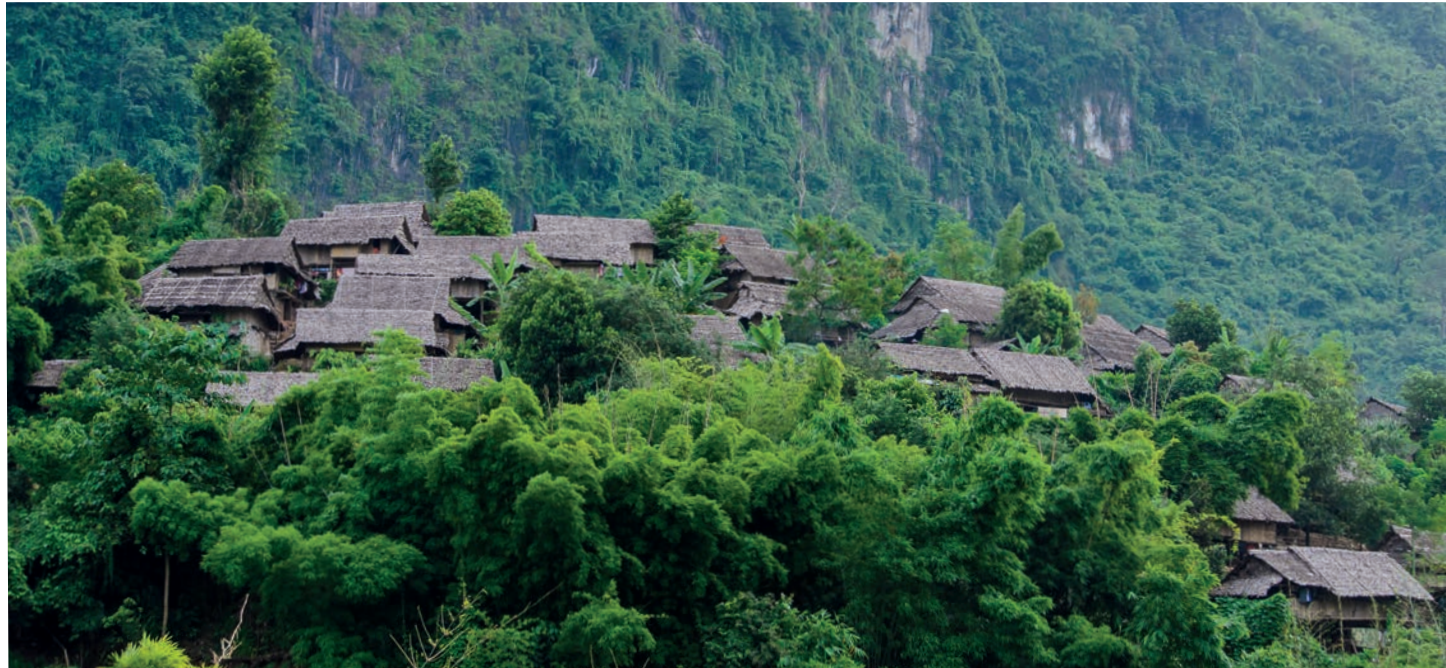
အဖိခိာ်-မဲာ်လကပုဘာ်ကိဘာ်ခဲဒဲကတိ၊ ဘူးဒီးဝဲစီ၊ ယီ၊ ကိာ်၊