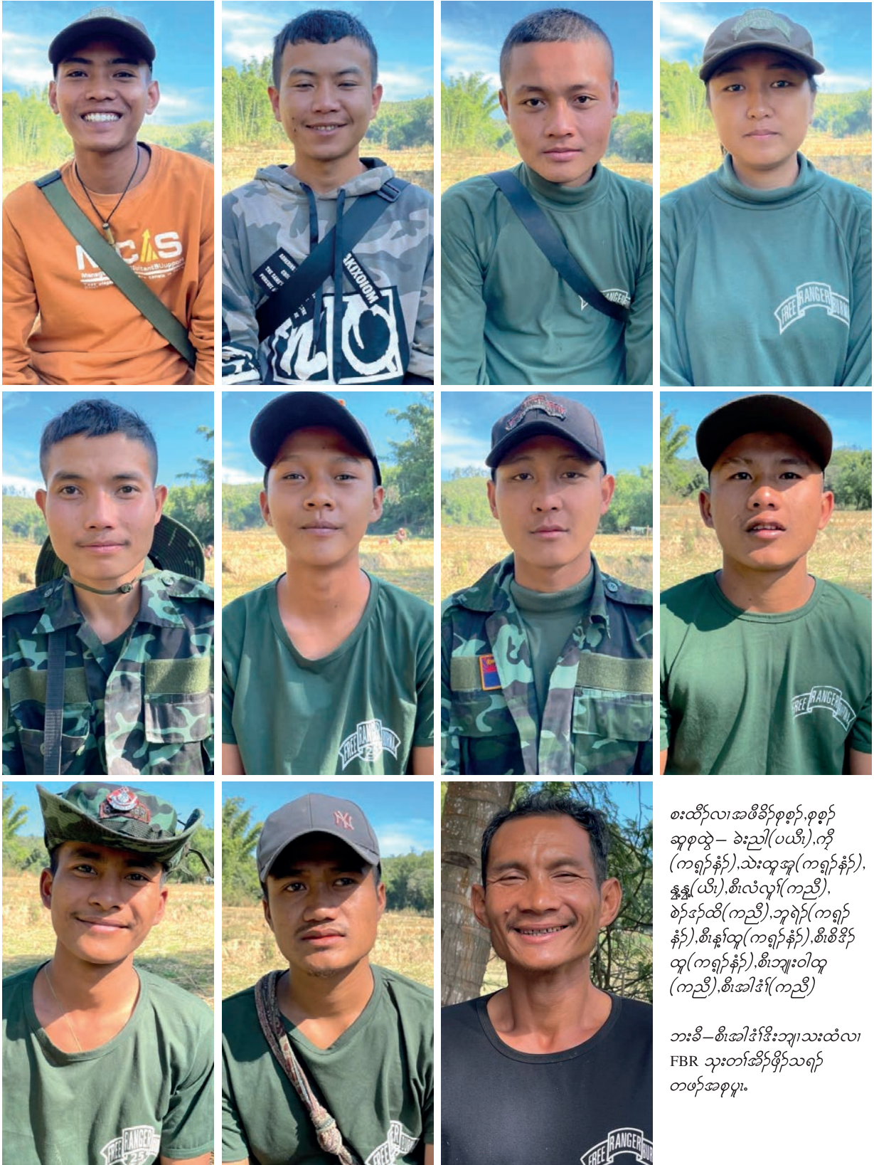
စးထီဉ်လၢအဖိခိဉ်စုစုာ်စုစုာ် ဆူထု - ခဲညါ(ပယီု)၊ကီု (ကရုာ်န့ဉ်)၊သးထုအု(ကရုာ်န့ဉ်)၊ န့ဉ်ယီု၊စါလံလုာ်(ကညီ)၊ စာ်အံထီ(ကညီ)၊ဘုရဲဉ်(ကရုာ် န့ဉ်)၊စါန့ဉ်ထု(ကရုာ်န့ဉ်)၊စါဖိခိဉ် ထု(ကရုာ်န့ဉ်)၊စါဘျုးဝါထု (ကညီ)၊စါအါဒ်(ကညီ) ဘးမိ-စါအါဒ်ဒိးဘျုးသးထံလၢ FBR သးတံဆိဉ်ဖျီဉ်သရဉ် တဖန်အစုပု၊