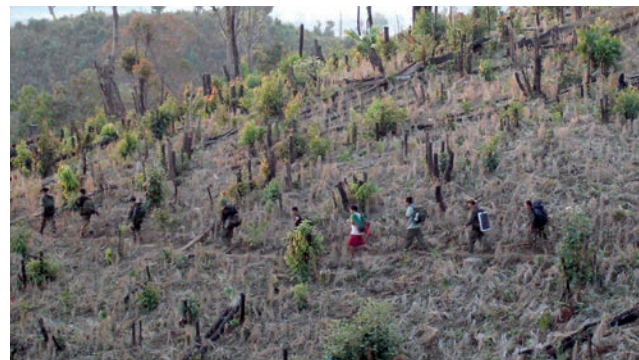
ကွီဖိတဖာ်စီာ်တတ်စု၊ တဖာ်လာ ကိာ်ပယီ၊ ကစါခိာ်၊