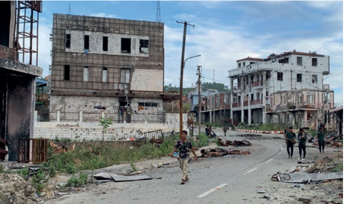
အဖီခိၣ်-နီၣ်သးတၢ်ကဲၣ်ခိၣ်ကဲၣ်န့ၢ်ကွဲးဖိတဖၣ်ထုကဖၣ်တၢ်လၢပိၣ်ခဲၣ်တၢ်ဂၤလၢအလိၣ်ကွဲးအပံၤဃုာ်ဖိဖိလၢတၢ်ဒုးတၢ်ယုၤလၢကတီၢ်ယုၤဘးခိ(အဖီခိၣ်ဆုၤအဖီလၢ)-ပယီၤသ့မ့ၢ်ခဲၣ်လိၣ်လၢကလဲၣ်ကျိအယံၢ်ထဲတလဲၣ်ဂၢၢ်ဟးဂီၢ်သ့ကွဲးကွဲးဒီးနီၣ်နီၣ်တၢ်မၤလိကွဲးဖိတဖၣ်ပုၤမ့ၢ်သးမၤကလိၣ်ခဲၣ်အိၣ်ထီၣ်ကသံတၢ်ကွဲးထွဲကသံဒုးဒုးလၢခီၣ်ကီၢ်စံာ်.

ပဟးခိၣ်ကွဲးဟံၣ်ဖျါလၢအလိၣ်သဘျုးတဖၣ်ပဲၣ်တြီတဖၣ်ဒီးကပိၣ်ကပပိၣ်ဖးဘၣ်ဒီးတဖၣ်လိၣ်ဟံၣ်လၢအဘျုးဒီးမ့ၢ်ပိၤယုၤ(၅၀၀)ပိၣ်ခဲၣ်ဖျါလိၣ်ဘၣ်န့ၢ်လိၣ်သဘျုးတုၤထီၣ်သ့ကွဲးသ့ကွဲးဒီးစၢ်ထးအက့ၢ်အခိပတံၤပတၢ်ပုၤတပူၣ်လိၣ်ဖဲပသမံသမိးကွဲးတၢ်ဘၣ်ဒီးဘၣ်ထံးအဆၢကတီၢ်န့ၢ်ပထံၣ်လိၣ်သးဒီးပုၤစုၤလၢအိၣ်တၢ်ဒီးသအသဝီ(လၢပုၤကဆုၣ်ပျီန့ၢ်ဆုၣ်တဖၣ်အစု)မ့ၢ်မ့ၢ်ဒီးသိးကထုကတၢ်လၢအထံၣ်လၢဟံၣ်ဖျါလၢအသဘျုးသဘျုးတဖၣ်အိၣ်အလီၢ်န့ၢ်လိၣ်ကွဲးဖိတဖၣ်တမၤလၢတၢ်ဆၢကတီၢ်လၢကရၢလိၣ်ဒီးသဝီဖိတဖၣ်ဘၣ်သံကွဲးသံဒီးတၢ်ဒီးက