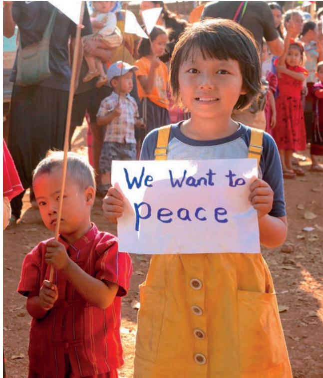
ဖိသ့ၣ်တဖၣ်ပုၤဘၣ်သကိးလၢတၢ်ဟံးဖျါတၢ်တဘျီသးအဂ့ၢ်, လၢကရၢန့ၣ်ကီၢ်စၢ်, ပယီၤကီၢ်.

တၢ်သ့ၣ်ညါဟံးပနီၣ်ကလုာ်ဒုၣ်အိၣ်ဆိးအလီၤအက့ၤတဖၣ်န့ၣ်(ကြးကဲထီၣ်တၢ်ကတီၢ်လိာ်သကိးသးအခိၣ်ထံးခိၣ်ဘိလၢကလုာ်ဒုၣ်အတၢ်ဆၢတံာ်လၢအနီၢ်