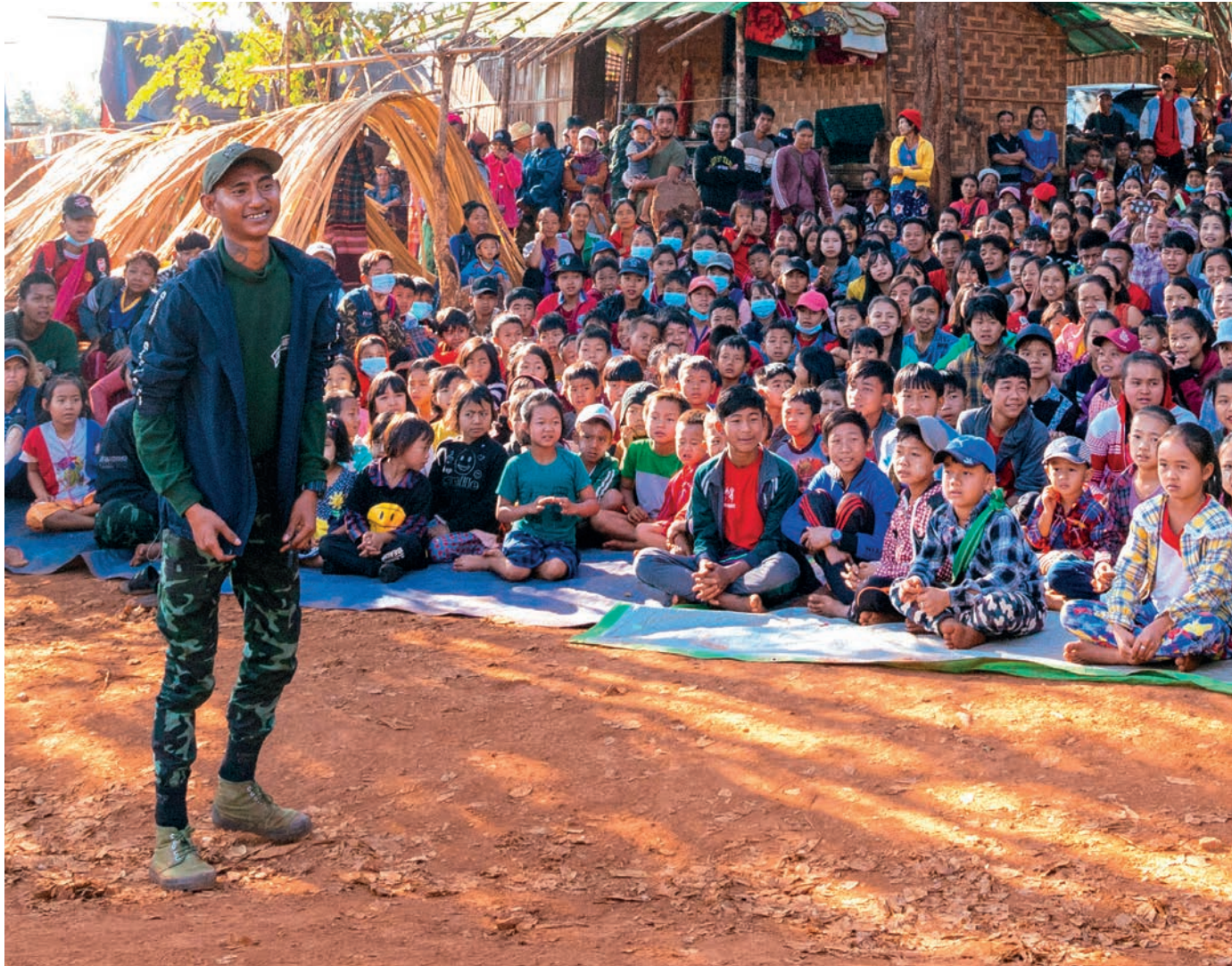
ဘးဒိအဖိခိဉ်—ကွဲးတီခိဉ်ရဲၣ်တၢ်ဆိဉ်မုၢ်လၢအဂုၤတၢ်ရဲၣ်တၢ်ကျဲးတခါလၢဖိသ့ၣ်လၢဘၣ်သ့ၣ်မ့ၢ်ပုၤမ့ၢ်လၢကီၢ်ပယိအပူၤ. ဘးဒိအဖိလၢ—ကွဲးဒီးဖဲထၢၣ်ယုဘး(ခ)ဂၤဒိတၢ်ဒုးန့ၣ်ဖုၣ်ကီၢ်လၢIDPs တဖၣ်လၢကရၢၣ်န့ၣ်ကီၢ်စၢ်.ကီၢ်ပယိအပူၤ.

ကွဲးအိဉ်ပုၤအါဂၤဒီးသးခုမၤန့ၣ်မၤအုပုၤဂၤလီၤ.အမုၢ်ဒါလၢ FBR အပူၤမ့ၢ်တၢ်ဝဲပယိသ့ၣ်တၢ်ရဲၣ်တၢ်ကျဲးလီၤ.အဝဲအိဉ်ဒီးတၢ်လၢဂၤဒီးဒုးန့ၣ်မၤန့ၣ်မၤအုတၢ်ဒီးကထီၣ်ဝဲခိဉ်န့ၣ်အိဉ်အကျိတကလၢသးသမုၢ်အဂုၤတၢ်ရဲၣ်တၢ်ကျဲးလၢဖိသ့ၣ်လၢဘၣ်သ့ၣ်မ့ၢ်ပုၤမ့ၢ်လၢကီၢ်ပယိအပူၤတဖၣ်အဂီၢ်လီၤ.အတၢ်န့ၣ်ကမ့ၢ်လၢအဂုၤလီၤသးဆုပုၤဂၤဒီးတၢ်လၢန့ၣ်ဒုးလဲလီၤတၢ်ဆိဉ်သးဒိတၢ်ခါလၢခိဉ်ယၢပဝးလီၤ.တဖၣ်ဒီးဘၣ်မုၢ်ဒါမံၤဂျၢၣ်တခါအပူၤဖဲပုၤမၤ GLC တၢ်ရဲၣ်တၢ်ကျဲးအဆၢကတီၢ်ကဘီယူၤဟဲကွဲးလီၤမ့ၢ်ပီၤလၢကပိာ်ကမၤလီၤ.ဖဲကဘီယူၤခးတပူၤလၢအယံၤဒုၣ်ထဲမံထၢၣ်တကယၢကပိာ်ကမၤဟဲန့ၣ်ကွဲးဟဲကွဲးစးထီၣ်တၢ်ရဲၣ်တၢ်ကျဲးစးဝဲ “ကဘီယူၤအဝဲအံၤက့ၤလံၤ.တဘၣ်မၤန့ၣ်မၤဘၣ်.ပကအိဉ်ဒီးသုလီၤ.ပမ့ၢ်ပုၤလၢအဆိဉ်ဒီးတၢ်သဘျုးဒီးပကယုထၢတၢ်သးခုလီၤ.အယိမိပ