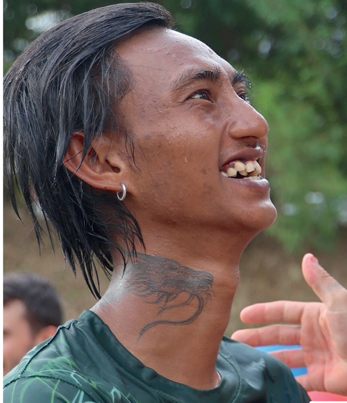
အဖီခိဉ်— ကွဲးဒီးဘျာသးထံဒီးသးခုလဲတံအိဉ်မုအသီအဂီၤ

ကြဲးဒီးဘျာအသးလဲထံဖဲလဲယုာ်လဲလွံာ်သီန့ဉ်လီၤတံအံမုာ်နံးလဲအလီၤလဲဒီးပျဲတံသးခုလီၤအဲလဲဉ်ယုာ်ဘဲ(ခ)လဲအမုာ်ပုမာတံသးခုကစိဉ်လဲယဟိတံကါအါန့ဉ်(၆၀)တဘျီစံးဝဲ“တံထုဉ်ဖျဲးလဲနီၤသးန့ဉ်မုာ်ဝဲထံဂုာ်ကံာ်သးအတံထုဉ်ဖျဲးအဂံာ်ခိဉ်ထံးလီၤယုာ်ဟ့ဉ်ပုတံထုဉ်ဖျဲးဒီးဖဲပဲဆဲးတံလဲယဟဲဉ်ယုဉ်ဂူးအခဲန့ဉ်ပထံဉ်လီၤက့ပသးလဲပုလဲအဆိဉ်ဒီးတံသဘျာ အအါကတံ၊ ထုဉ်ဖျဲးလဲတံဆဲဉ်လီၤထဲသး၊ သဘျာ လဲကဆဲဉ်ပုကဲ၊ သဘျာ လဲကပျံာ်ပုကဲအတံကမာ်၊ ဒီးသဘျာ လဲကဟိတံအိဉ်မုလဲယုာ်အိဉ်ဟဲလီၤလဲပဲတဂမုာ်စုာ်အဂီၤလီၤ”