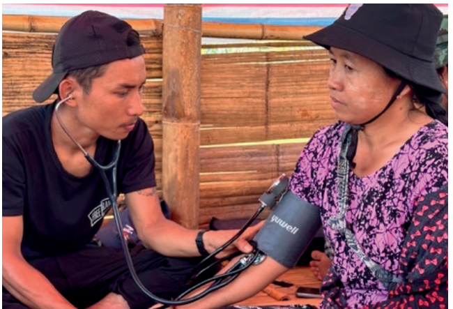
အဖိခိၣ်-တီၢ်စလဲၣ်တၢ်ဆါဒီး.ဘၣ်တၢ်မၤဟးဂီၢ်အိၣ်လၢပယီၤသုးမ့ၢ်အတၢ်ဟံၣ်လီၤမ့ၢ် ဟီၣ် ၂၀၂၃ န့ၣ်.လၢမ့ၢ်အသီ(၁၀) အဖိလဲ- IDP တကၢၤဒီးန့ၢ်ဘၣ်တၢ်ကွၢ်ထွဲလၢပုၤကသံၣ်သရိၣ်ဖိတကၢၤအအိၣ်.

တံၤသကိးသးဘိသ့ၣ်စ့ၢ်.ဝဲသးစူၤထုကဖၣ်န့ၣ်လၢပုၤကသံၣ်ဖိတဖၣ်အဂီၢ်.ဒ် သိးအဝဲသ့ၣ်ကအိၣ်မုၢ်ဒီးဆူညါ.ဒီးပမၤစၢအဝဲသ့ၣ်လၢကယုထံၣ်န့ၣ်ဘၣ်တၢ်လီၤ တၢ်ကွဲးလၢကအိၣ်ခုသ့ၣ်ဒီးဘျီထီၣ်ကွဲးတၢ်ဆါဟံၣ်.တၢ်ဆါဒီးတဖၣ်လၢကမၤစၢ ယၢဘျီကွၢ်ထွဲဘၣ်သးသမုတဖၣ်အဂီၢ်န့ၣ်တက့ၢ်.သဝီဖိလၢအကယၢတဖၣ်ဘၣ် သံတၢ်.ယုၣ်ဒီးကဝိၤပုၤဟံၣ်ဆါတဖၣ်.ပုၤဘၣ်ဒီးဘၣ်ထံးဒီးလိၣ်ဘၣ်တၢ်မၤစၢ ဖးဒိၣ်လီၤ.ထဲလၢကရၢၢ်န့ၣ်ကီၢ်စဲၣ်ထဲတခါအပူၤပုၤအါန့ၢ်သၢကလီၢ်ဘၣ်သုးလီၢ် သုးကွဲး.အါတက့ၢ်လိၣ်ဘၣ်ကသံၣ်ကသီတၢ်ကွၢ်ထွဲဒီးခဲလဲၣ်ဘၣ်အိၣ်မူလၢတၢ် ပျံၤတၢ်ဖးအပူၤလီၤ.ကီၢ်ပယီၤဒီးတဘျီအပူၤပုၤဘၣ်သုးလီၢ်သုးကွဲးအါန့ၢ်သၢကကွဲၣ် လဲလီၤ.ဝဲသးစူၤထုကဖၣ်န့ၣ်လၢထံကီၢ်တဖၣ်ကအိၣ်ဒီးတၢ်သးအိၣ်လၢကယုထၢ မၤစၢပုၤသ့ၣ်တဖၣ်လၢဖဲအံၤအဂီၢ်န့ၣ်တက့ၢ်.