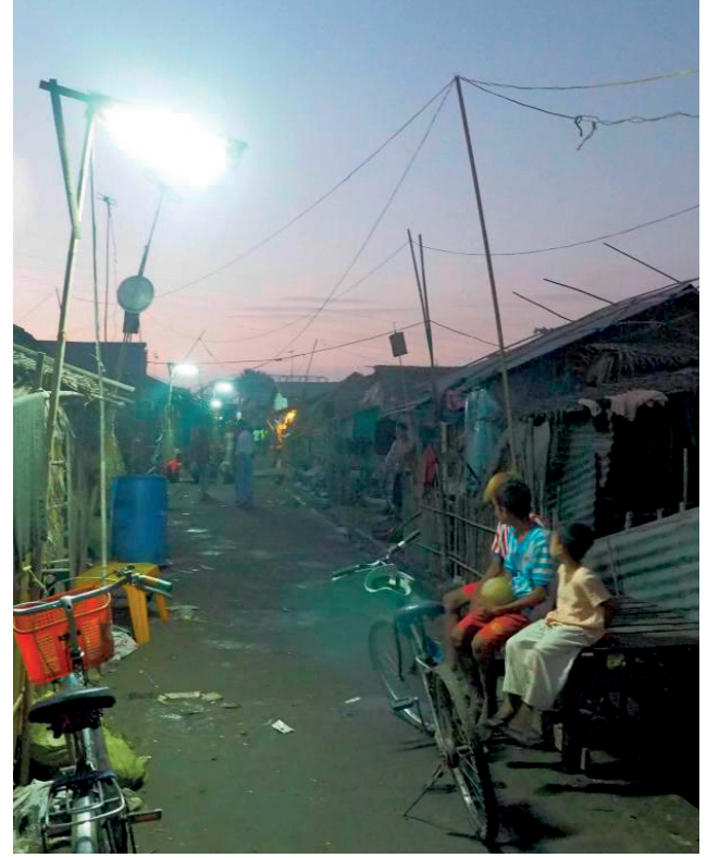
အဖီခိဉ်— ဝဲတက့ဉ်အချာလီၤဖျိဉ်ယာ်တဖဉ်

တံထုကဖဉ်လီၤဆိတခါကမုာ်ဝဲ YSO ဖဲတဖဉ်အဂီၤဟံဉ်ခွဲလီၤတံဒီးလဲဟံဉ်အပူဟဲအါထီဉ်ဒီးဟံဉ်လဲအအဲအံးပဒီးလဲယာ်တဖျဉ်န့ဉ်ပုကဲအါအါလီၤပလိဉ်ဘဉ်ပုာ်ကိးကဲအတံထုကဖဉ်လဲပဂီၤခိဉ်ဖျိဉ်လဲပအိဉ်ဒီးဖဲသ့ဉ်ဟံဉ်ဖဲယိဖဲအါကအယိ၊ တံကံတံခဲအိဉ်လဲကကဲဒီးလဲဟံဉ်အဂီၤလီၤ ဝဲသးစုထုကဖဉ်န့ဉ်ပုာ်လဲအဆိဉ်လဲဝဲတက့ဉ်လီၤဖျိဉ်ယာ်တဖဉ်ဒီးသိးကသ့ဉ်ညါထီဉ်ယုဉ်ဂူးဒီးပုာ်အုဉ်ခိဉ်က့အဝဲသ့ဉ်အဂုာ်တက့ဉ် ဝဲသးစုထုကဖဉ်လဲပကရုဒီးကရုဖဲတဖဉ်အဂီၤလဲယုာ်ကဟ့ဉ်ပုာ်တံက့ဉ်သ့က့ဉ်ဘဉ်ဒီးသိးကမာတံလဲဝဲလီၤဖျိဉ်ယာ်အံးအဂီၤ ဝဲတက့ဉ်လီၤဖျိဉ်ယာ်တဖဉ်အပူ၊ ပုာ်အါကအတံဖဲးတံမာမာအိဉ်ဒီးတံအိဉ်ဘဉ်အိဉ်ဘဉ်စုာ်ကိးတဆိဉ်ဘဉ်၊ ဝဲသးစုထုကဖဉ်န့ဉ်လဲအဝဲသ့ဉ်ကိးန့ဉ်အတံအိဉ်အဂီၤတက့ဉ်