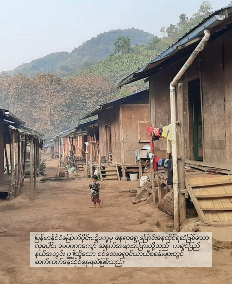
မြန်မာနိုင်ငံမြောက်ပိုင်းပဋိပက္ခမှ နေရာရွှေ့ပြောင်းနေထိုင်ရဆဲဖြစ်သော လူပေါင်း ၁၀၀၀၀ကျော် အနက်အများအပြားတို့သည် ကချင်ပြည်နယ်အတွင်း ဤသို့သော စစ်ဘေးရှောင်ယာယီစခန်းများတွင် ဆက်လက်နေထိုင်နေရဆဲဖြစ်သည်။

ရွာအချို့တို့သည် အခြေခံကျောင်းများအပါအဝင် ကျောင်းများမရှိခြင်း၊ ကျေးရွာ ကျန်းမာရေး စောင့်ရှောက်သူတစ်ဦးမျှမှပင် မရှိသော၊ ကျန်းမာရေးစောင့်ရှောက်မှု အကူအညီများ ကင်းမဲ့လျက်ရှိပါသည်။ စီးပွားရေးနှင့်ပညာရေး အခွင့်အလမ်းများ ကင်းမဲ့နေသောအခြေအနေတွင် ရွာသားအများစုတို့သည် ဘိန်းဖြူထုတ်လုပ်ရန် ဘိန်းပင်များ စိုက်ပျိုးကြသဖြင့် လူမှုရေးဘဝ ပျက်စီးကြရကာနာဂအသိုင်းအဝိုင်းများအတွင်း အနှံ့အပြားဘိန်းစွဲလာသည့် အခြေအနေသို့ ရောက်ရှိလာပါသည်။